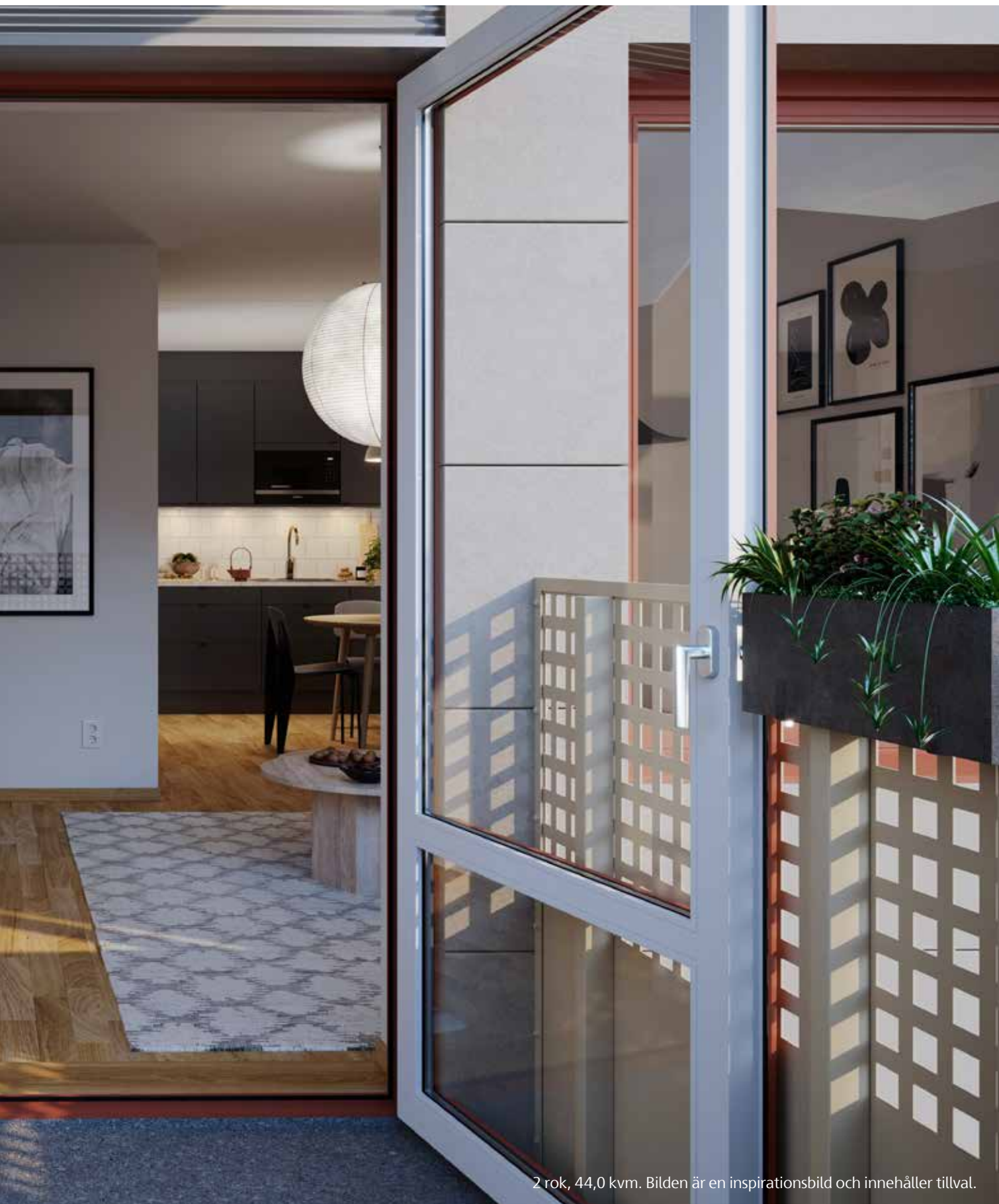
2 rok, 44,0 kvm. Bilden är en inspirationsbild och innehåller tillval.