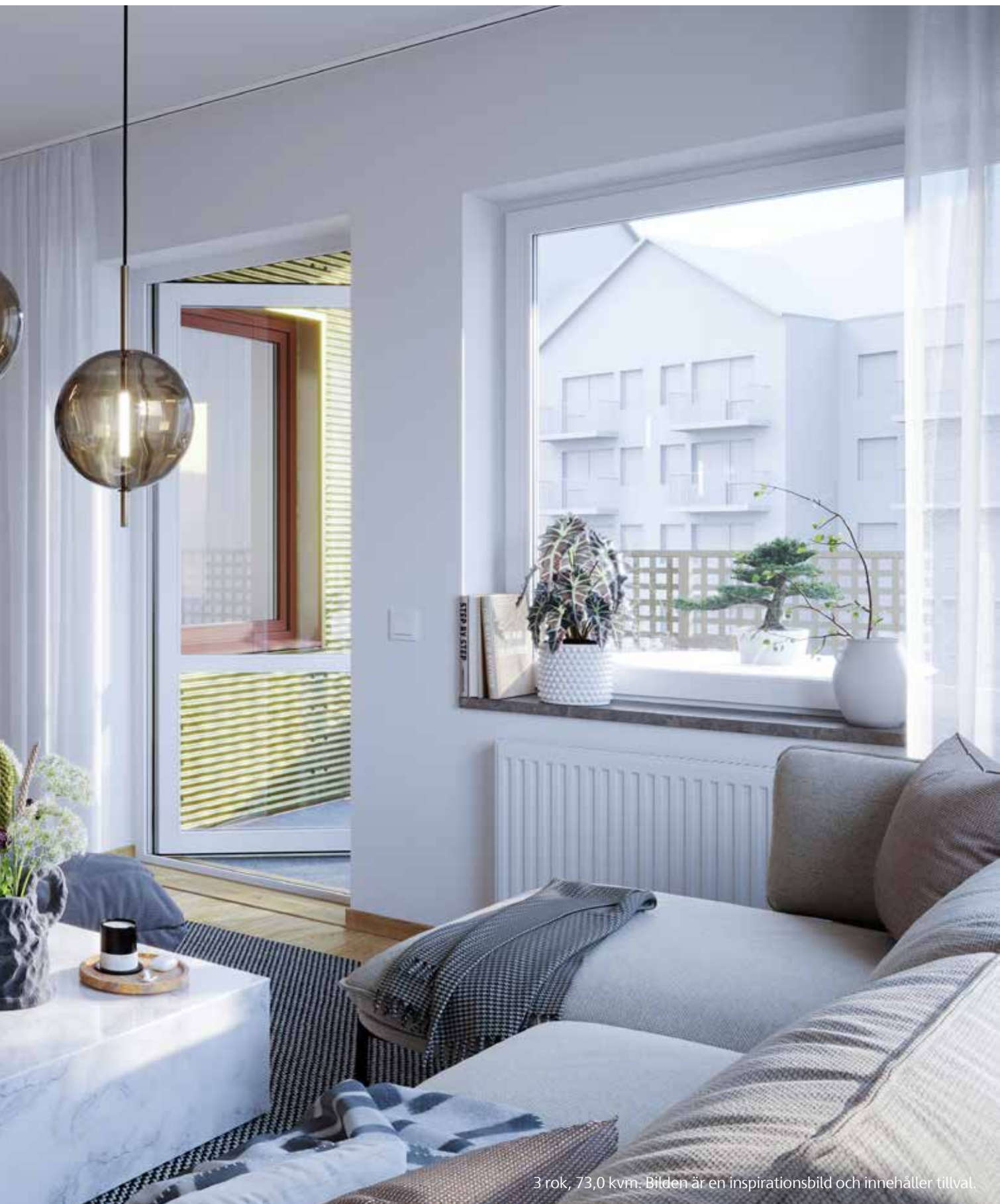
3 rok, 73,0 kvm. Bilden är en inspirationsbild och innehåller tillval.