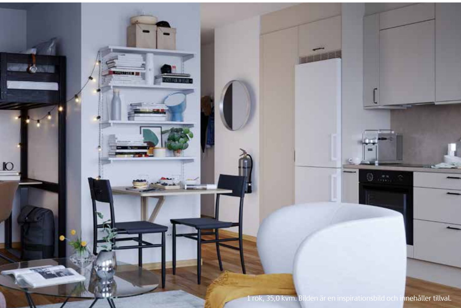
1 rok, 35,0 kvm. Bilden är en inspirationsbild och innehåller tillval.